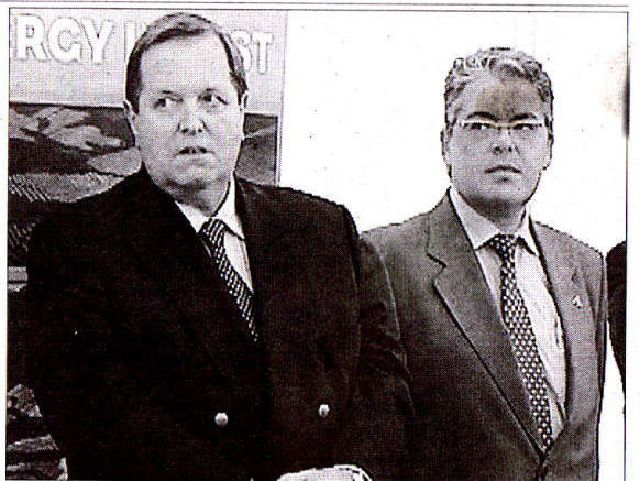
■ Representantes del Grupo ASSET, filial alemana que promueve el huerto.